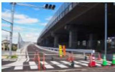
岩槻ICから蓮田方面へ、開通直前の様子